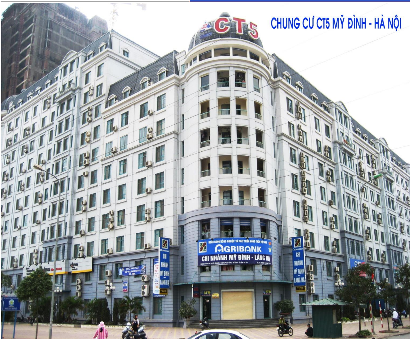
CHUNG CỬ CT5 MỸ ĐÌNH - HÀ NỘI